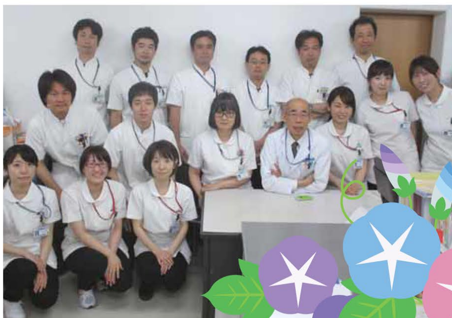
薬剤部スタッフ一同

そんな時に患者さんの立場でお薬について考え、よいアドバイスができるように努めています。私たちスタッフ一同、地域になくってはならない病院薬剤師を目指して日々業務に取り組んでいます。