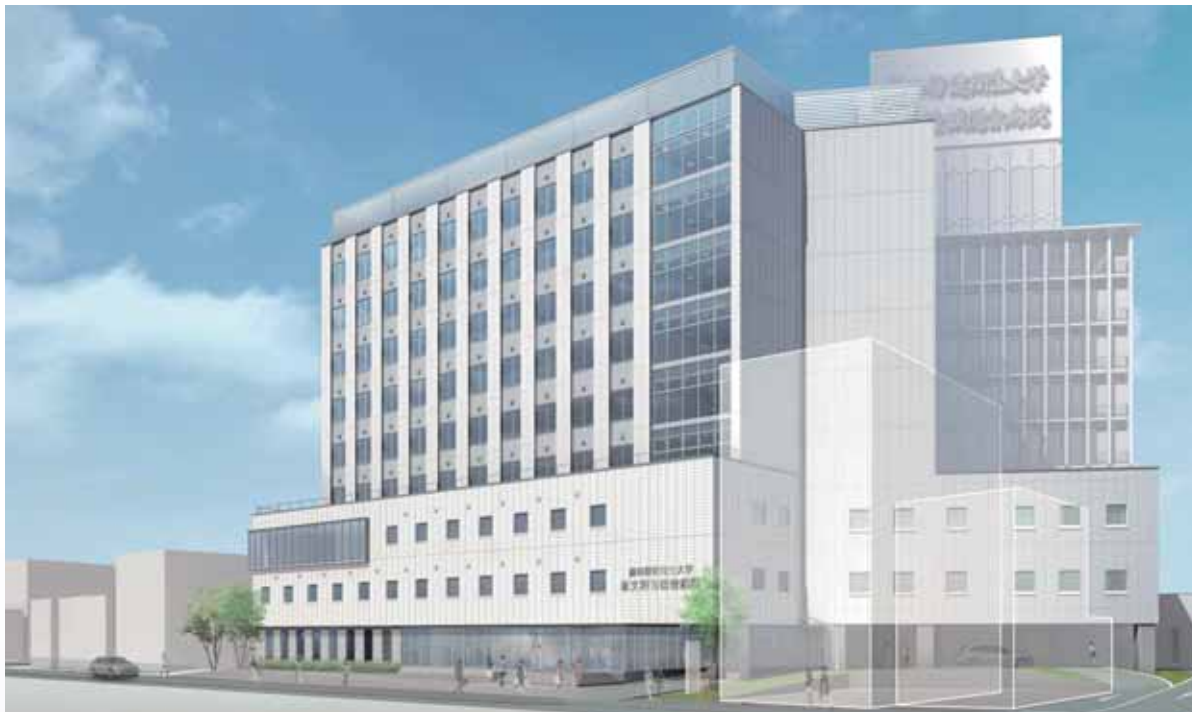
※完成予想図のため、実際とは異なることがあります。

当院は本年6月より平成28年7月中旬を目処に、新病棟建設工事を進めております。 ご来院の皆様や近隣の皆様にはご迷惑をおかけしますが、ご理解とご協力をお願いいたします。