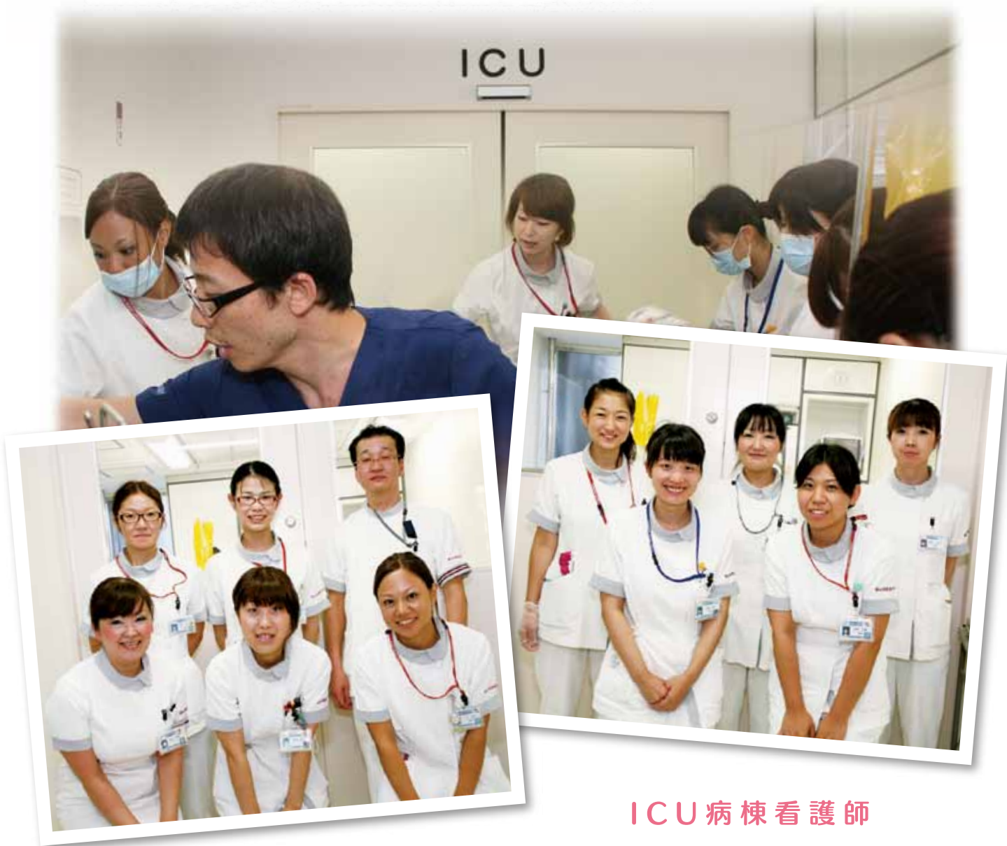
ICU 病棟 看護師

ばんたね病院では、より高度かつ安全に治療とケアができる体制を整える目的で、2階外科病棟の奥に ICU 病棟（集中治療室）を開設いたしました。ICU 病棟内には多くの高度医療機器と経験豊富な看護スタッフが手厚く配置されております。休日も含めた毎朝 8 時には、患者さんの採血・レントゲンなどその日の検査結果をすべてそろえ、それを基に各専門領域の医師・看護スタッフなどが集まって、それぞれの患者さんに関する当日最良の治療方針を検討し、24 時間体制で集中治療を行っています。